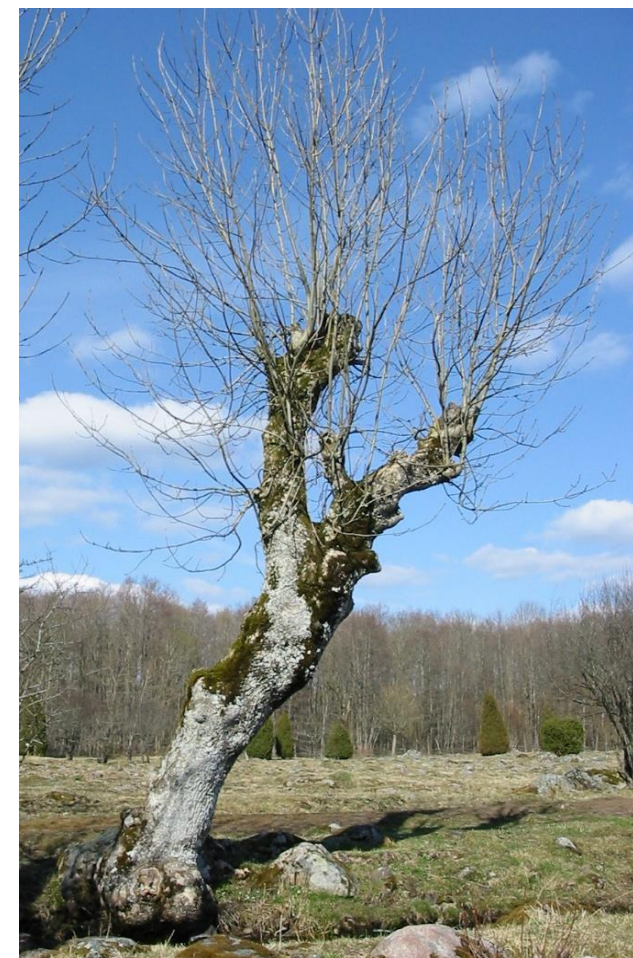
Hamlad ask på Mölarps ö.

Fristads naturskyddsförening är en fristående förening, vars främsta intressen är att skydda naturen och att väcka intresse för den.